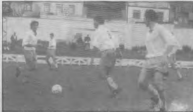
Los jugadores alcalaños no dieron la medida en Puebla y cosecharon una derrota muy clara.

INCIDENCIAS: Buen ambiente en el San Sebastián, con un buen número de seguidores alcalaños que regresaron muy decepcionados.