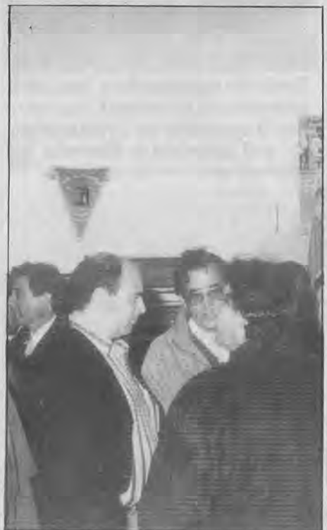
El técnico y la directiva aún confía en las opciones del equipo.

El Alcalá debe ir a lo suyo y esperar a que vuelvan a pinchar sus directos rivales.